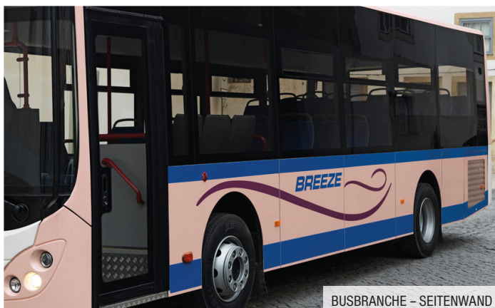
BUSBRANCHE – SEITENWAND