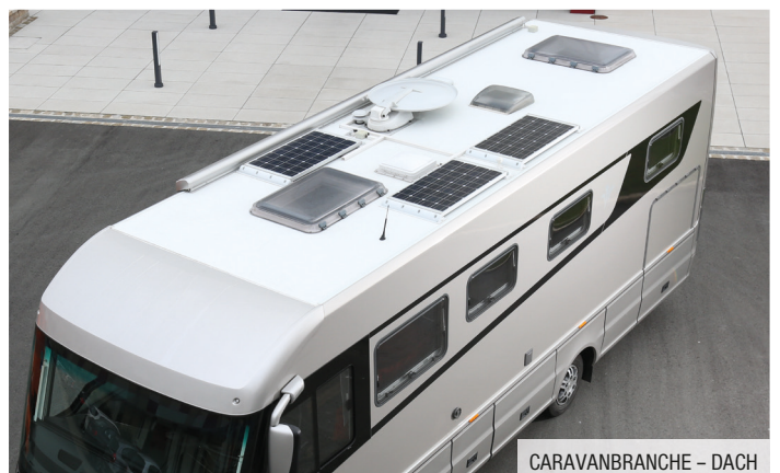
CARAVANBRANCHE – DACH

Die Angaben in diesem Datenblatt basieren auf unseren derzeitigen Kenntnissen und Erfahrungen. Sie stellen keine Zusicherung von technischen Eigenschaften im Rahmen einer Spezifikation dar. Die Eignung des Produktes für den jeweiligen Anwendungsfall ist auf Grund der vielfältigen Anwendungsparameter vom Verwender selbst zu prüfen. Irrtümer und Änderungen vorbehalten.