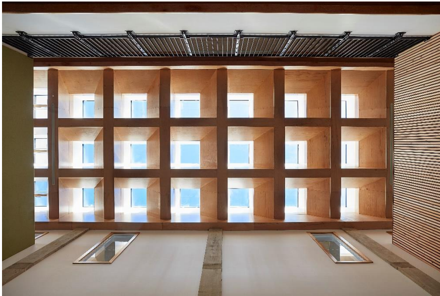
Passivhaus zertifiziertes Flachdach Fenster sorgt für natürliche Atmosphäre