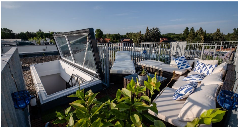
Bild 4: LAMILUX Flachdach Ausstieg Komfort Swing für maximalen Wohnkomfort – auch auf dem Dach