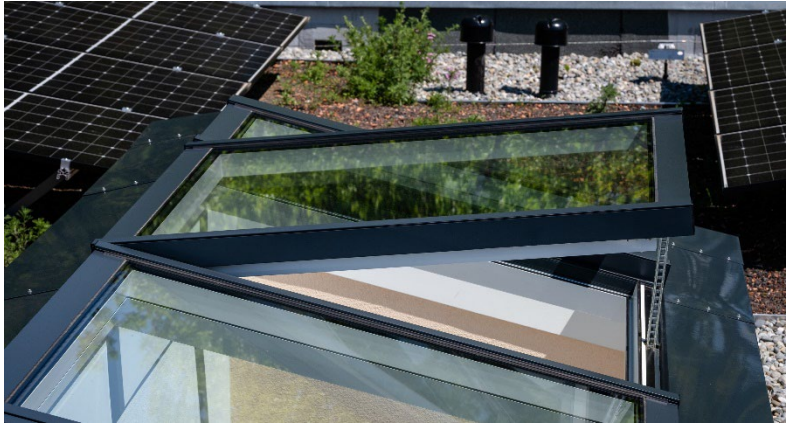
Bild 3: Tageslicht und frische Luft dank des Modularen Glasdachs MS78 von LAMILUX