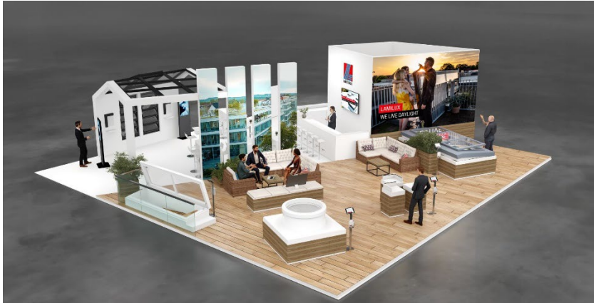
Bild 1: LAMILUX Messestand mit einladender Dachterrassen-Atmosphäre bei der BAU 2025

Weitere Informationen finden Sie unter www.lamilux.de/tageslichtsysteme/bau-2025