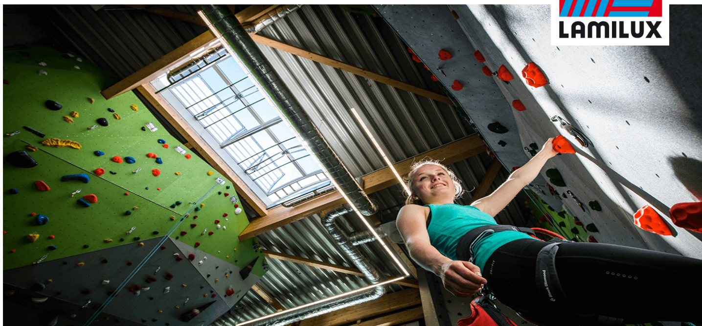
Kletterzentrum OWL, Brakel