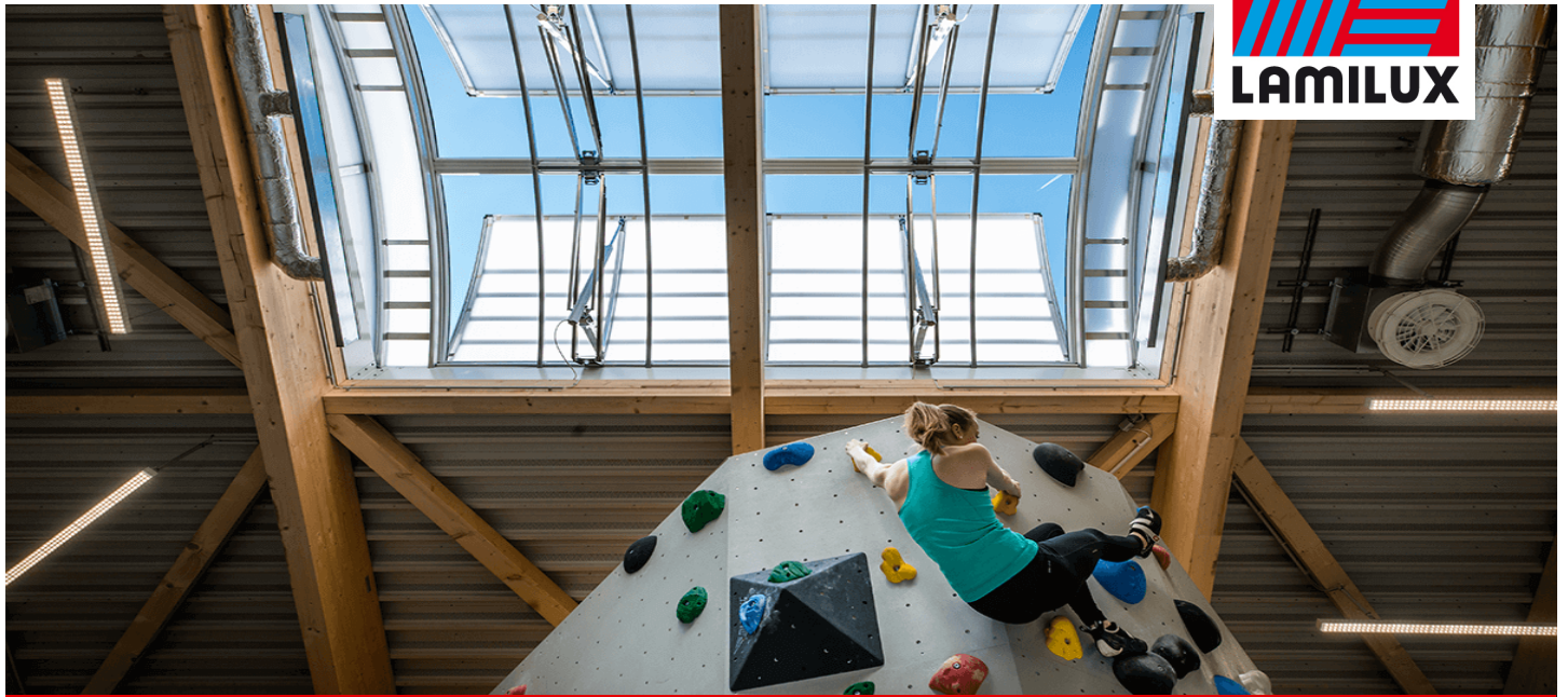
Kletterzentrum OWL, Brakel