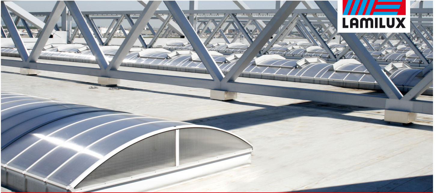
Lufthansa A380 Werft, Frankfurt